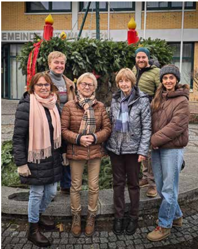
Danke an die Ortsbauernschaft, die auch heuer wieder einen wunderschönen Adventkranz für unseren Marktbrunnen gebunden hat.