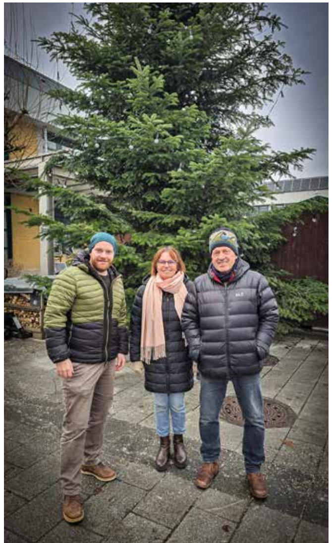
Ein herzliches Dankeschön an Familie Friedl, Grub 1, für den gespendeten Weihnachtsbaum, der den Marktplatz schmückt.