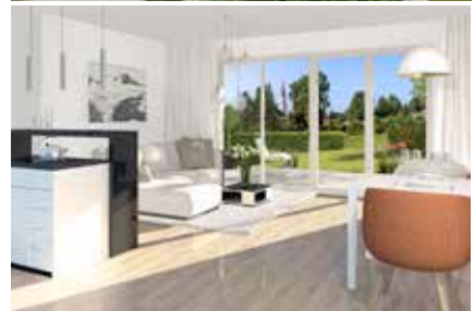
HITTHALLER WIR BAUEN WITTE