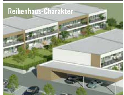
Moderne Eigentumswohnungen Baustart: Herbst 2025